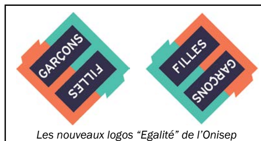
Les nouveaux logos "Egalité" de l'Onisep

L'Onisep, office national pour l'information sur les emplois et les professions, fait partie des cinq premiers signataires de la Convention d'engagement à produire une communication publique sans stéréotypes de sexe.